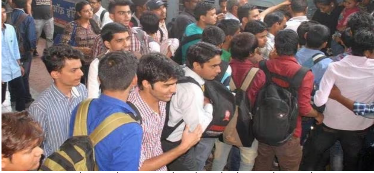
దిగుబడి వచ్చిందని అంచనా వేసినా రూ.9 వేలు నష్టం తప్పడం లేదు. *తేమ పేరుతో దోపిడీ

* రైతును నిలుపునా ముంచుతున్న ప్రభుత్వం * తేమ పేరుతో ధరలో భారీ కోత * నిబంధనలతో వేధిస్తున్న యంత్రాంగం * ప్రైవేటు వ్యాపారులకు అయినకాడికి అమ్ముకుంటున్న అన్నదాతలు మిగ్ జాం తుపాను రైతును నిండా ముంచింది. పరి కోతలు మొదలైన సమయంలో తుపాను విరుచుకుపడటంతో పరి రైతు నిండా మునిగాడు. దీనికి ప్రభుత్వ నిర్లక్ష్యం కూడా తోడు కావడంతో పరిసార్ల రైతుకు భారీ నష్టం వాటిల్లింది. సాగునీరు ముందుగా విడుదల చేయకపోవడంతో డెల్టా రైతులు నెల రోజులు అలస్యంగా నాట్లు చేశారు. దీంతో నవంబరు నాటికే పూర్తి కావాల్సిన పరి కోతలు, డిసెంబరు మొదటి వారంలో విరుచుకుపడ్డ మిగ్ జాం తుపానుతో పరి పంటకు తీవ్ర నష్టం వాటిల్లింది. పరి పంట వారం పది రోజులు నీటిలో ముగిసిపోవడంతో ధాన్యం మొలకెత్తింది. నూర్పాడి చేసిన రైతులు ధాన్యం తడవకుండా కాపాడుకునేందుకు టార్పాలిన్లకు వేలల్లో ఖర్చు చేయాల్సి వచ్చింది. ఇంత చేసినా ధాన్యంలో తేమ శాతం ఎక్కువగా ఉండటా మద్దతు ధరలో భారీ కోతలు వేయడం శోచనీయం. *బోనస్ ఇవ్వకపోగా మద్దతు ధరలో కోత